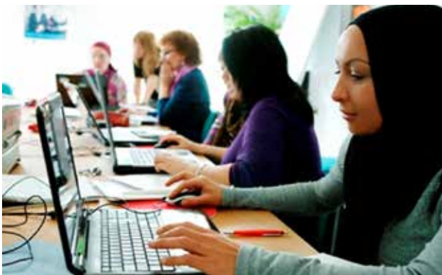
Unterricht in der Frauencomputerschule

Frauen mit Migrationsgeschichte haben erschwerte Zugangsvoraussetzungen in den Ausbildungs- und Arbeitsmarkt. Um die Integration in die Arbeitswelt zu erleichtern haben sich vier Träger aus der Stadt Kassel im Projekt DIGI TURN gefunden, um ihren Beitrag mit folgenden Schwerpunkten zu leisten: